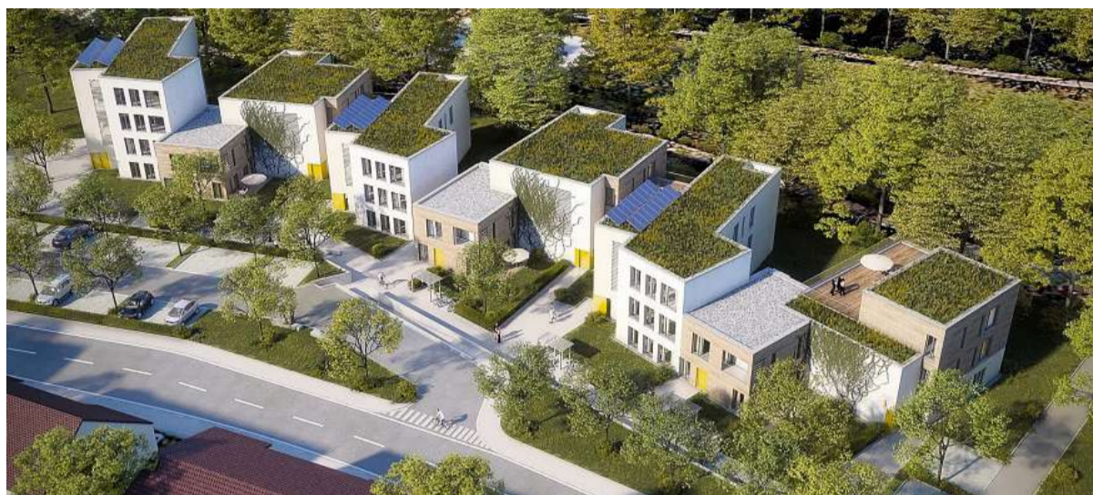
Mit diesem städtebaulichen Stegreifentwurf überzeugte das Büros Hartung & Ludwig aus Weimar sowohl die Jury als auch den Aufsichtsrat der Wohnungsgesellschaft Apolda (WGA).

Der favorisierte Entwurf überzeuge unter anderem dadurch, dass die Bebauung dezent zurückgenom-