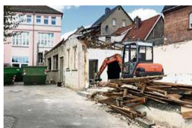
Bad Sulzas alte Schülerspeisung wird abgerissen.

Schulverbund Piffelbach Im Zentrum der Arbeiten steht der Ersatz-